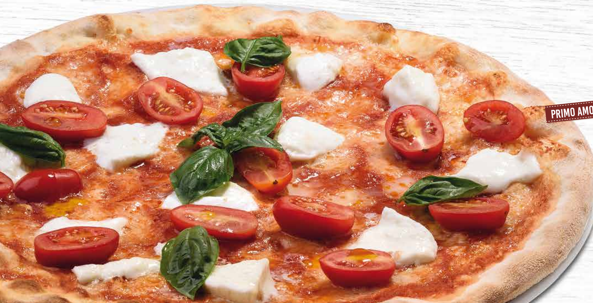
PRIMO AMORE CON BUFALA